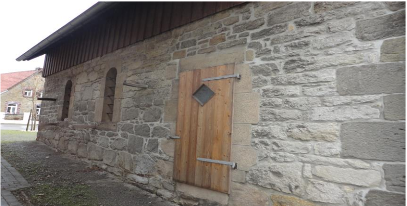
Spritzenhaus: Seitenansicht mit „Gefängnistür“