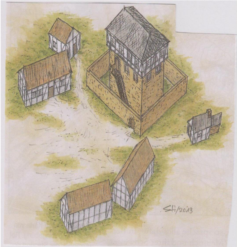
Zeichnung: R.Stirnberg, Schwerte