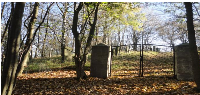
Eingangstor zum jüdischen Friedhof