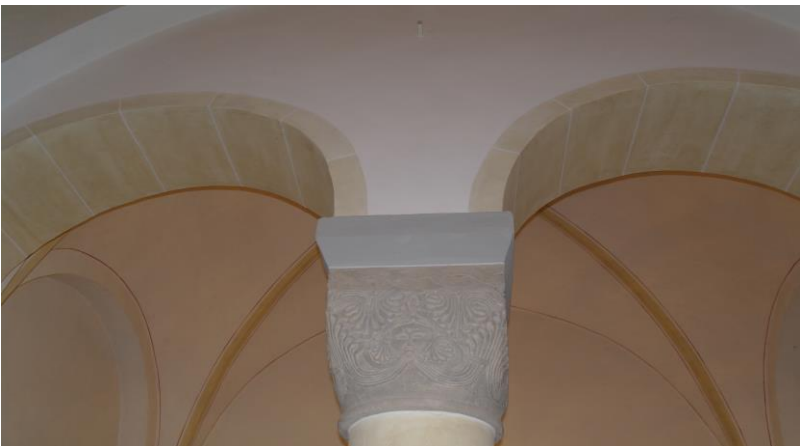
Kirche: Bogenarkade mit Ringbandkapitell aus dem 12. Jahrh.