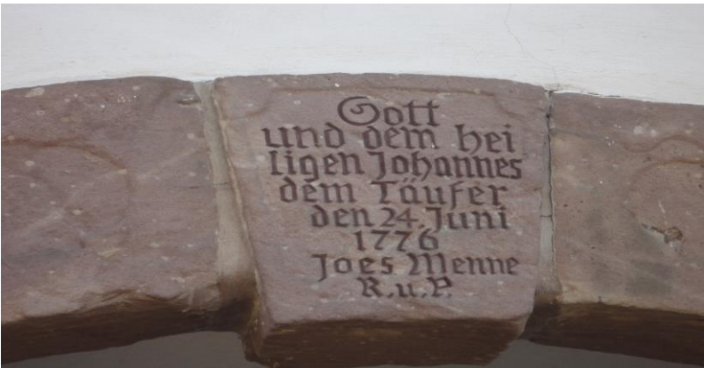
Schlussstein mit der Jahreszahl 1776