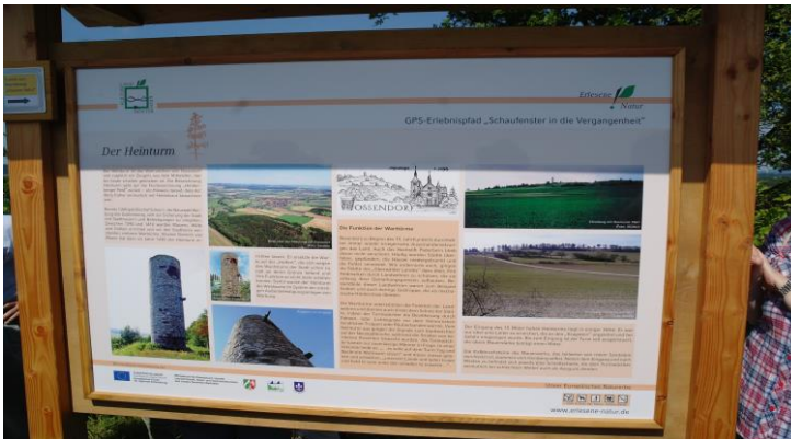
Hinweisschild auf dem Heinberg

Der Turm ist unter siedlungs- und territorialgeschichtlicher Betrachtung ein bemerkenswertes Denkmal