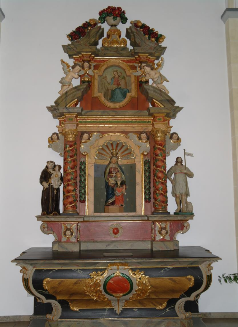
Seitenaltar in der Ossendorfer Kirche