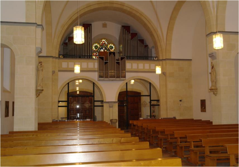
Kirche: Innenraum Blick nach Süden