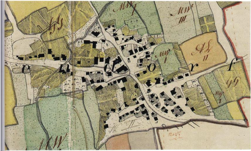
Ossendorf: Urrissübersicht von 1832 - Ausschnitt

Ossendorf wurde in jungsteinzeitlicher Zeit von Menschen als Siedlung ausgesucht. Dabei mag die Lage am Flusslauf der Diemel und der Bäche Naure/ Ohme eine Rolle gespielt haben.