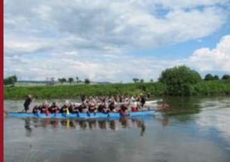
Dragon Power Cup-Beverungen