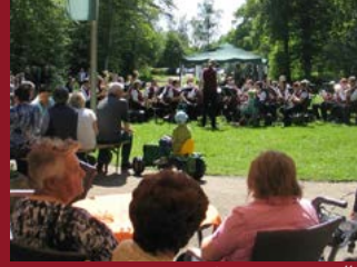
Kurkonzert am „Kaiserbrunnen“