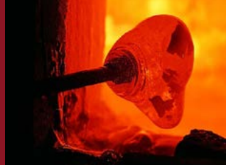
Glasbläserfest Bad Driburg