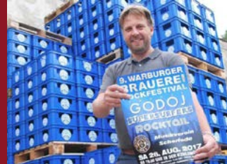
Rockfestival - Warburger Brauerei