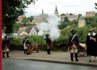
Das Kälkenfest in Warburg