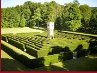
Gräflicher Park Bad Driburg